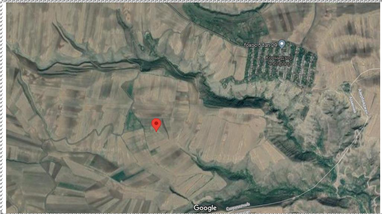
Գնահատվող գույքի գտնվելու վայրը

https://www.google.ru/maps/place/39%C2%B032'19.2%22N+46%C2%B030'35.9%22E/@39.5387452,46.5101699,491m/data=!3m1!1e3!4m5!3m4!1s0x0:0x79b8bd0947f31954!8m2!3d39.538654!4d46.509969