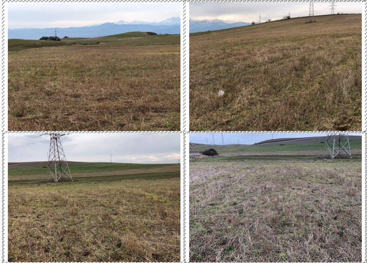
Անշարժ գույքի լուսանկարները