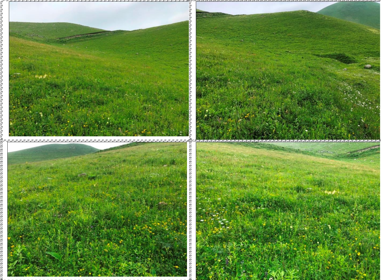
Անշարժ գույքի լուսանկարները