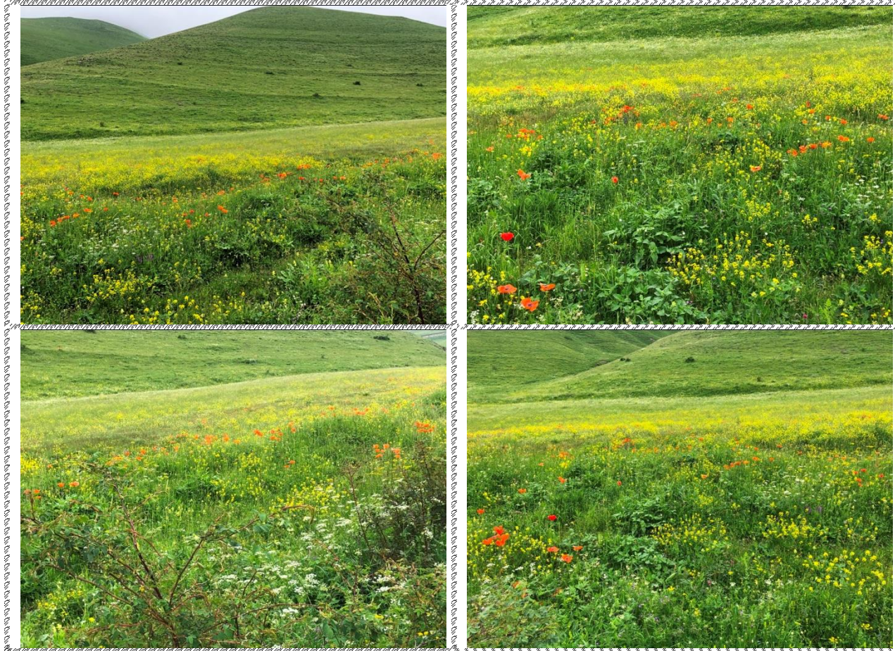
Անշարժ գույքի լուսանկարները