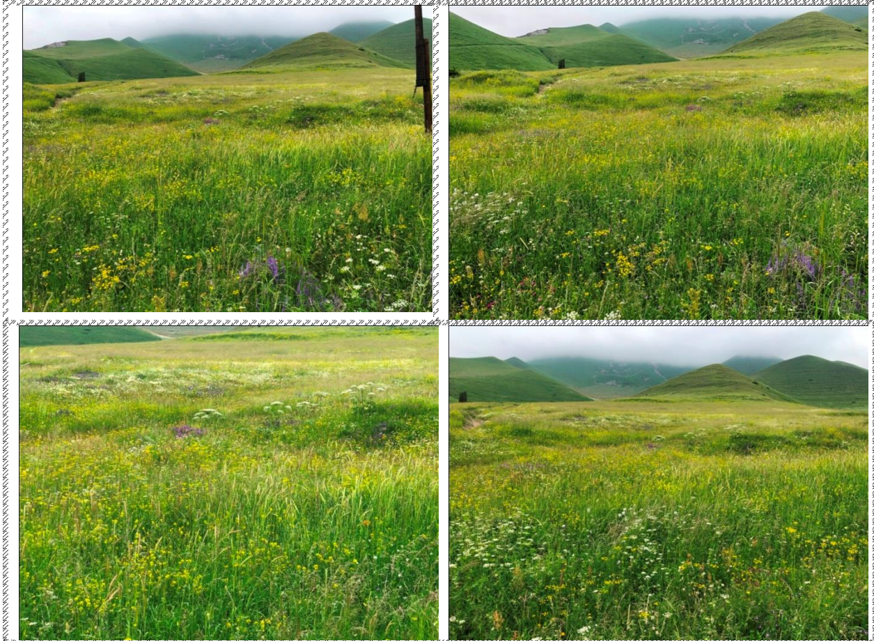
Անշարժ գույքի լուսանկարները