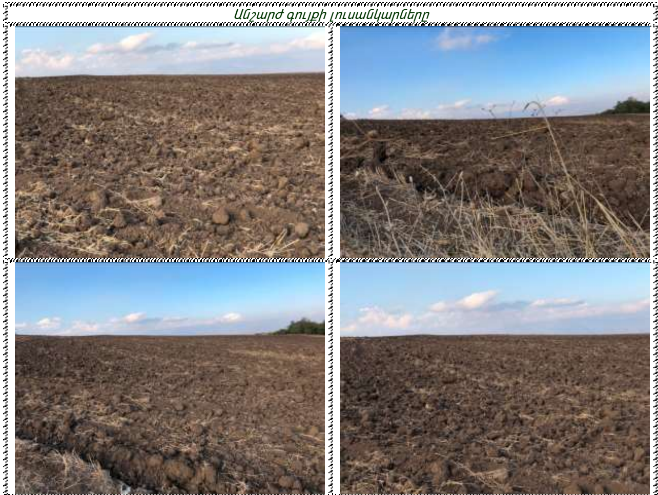
Անշարժ գույքի լուսանկարները