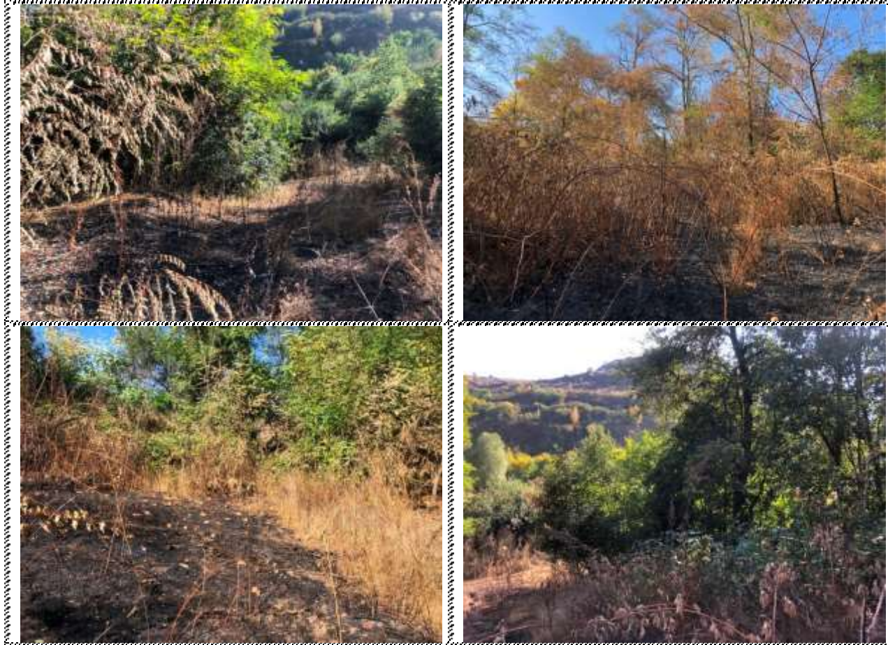
Անշարժ գույքի լուսանկարները