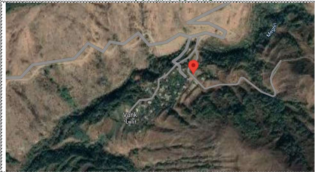
Գնահատվող գույքի գտնվելու վայրը

https://www.google.com/maps/place/39%40%27%22N+46%40%15%27%22E/@39.05028146,2530625.159m/data=!3m1!1e3!4m5!3m4!1s0x0:0xd205930801136510!8m2!3d39.050076714d46.2532363