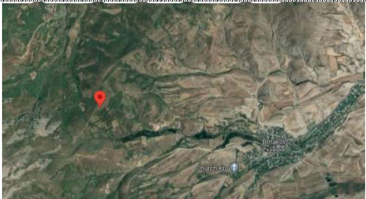
Գնահատվող գույքի գտնվելու վայրը

https://www.google.com/maps/place/39%C2%B030'22.6%22N+45%C2%B055'10.4%22E/@39.5069752,45.9200763,1339m/data=!3m1!1e3!4m5!3m4!1s0x0:0x459c063b5ab1a046!8m2!3d39.506273!4d45.919558