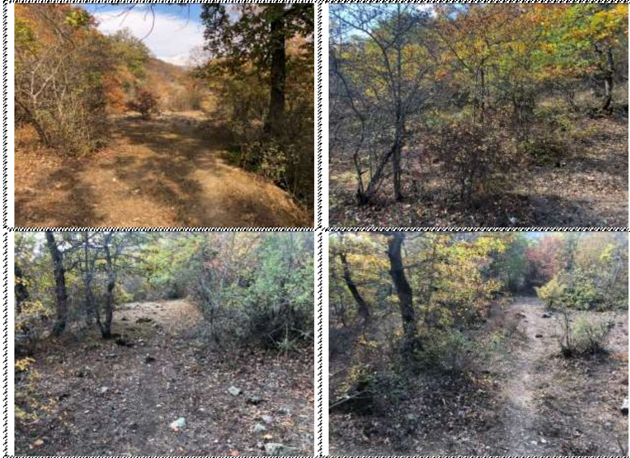
Անշարժ գույքի լուսանկարները