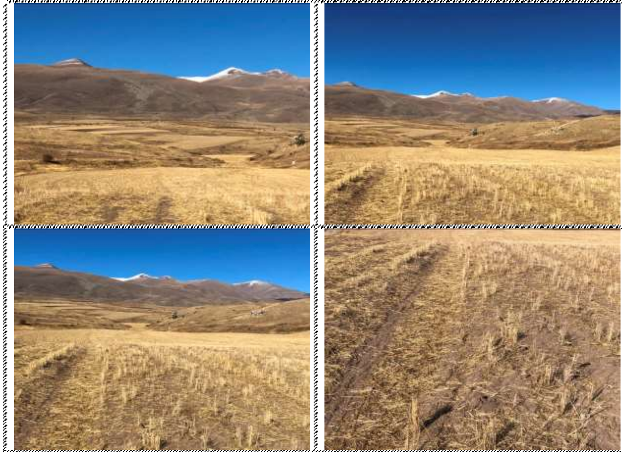
Անշարժ գույքի լուսանկարները