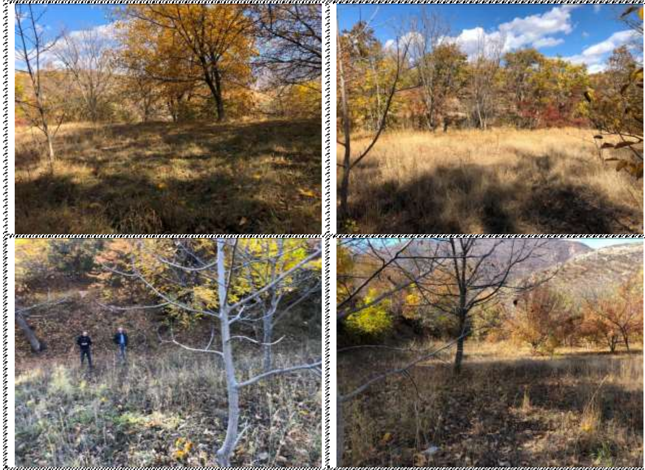
Անշարժ գույքի լուսանկարները