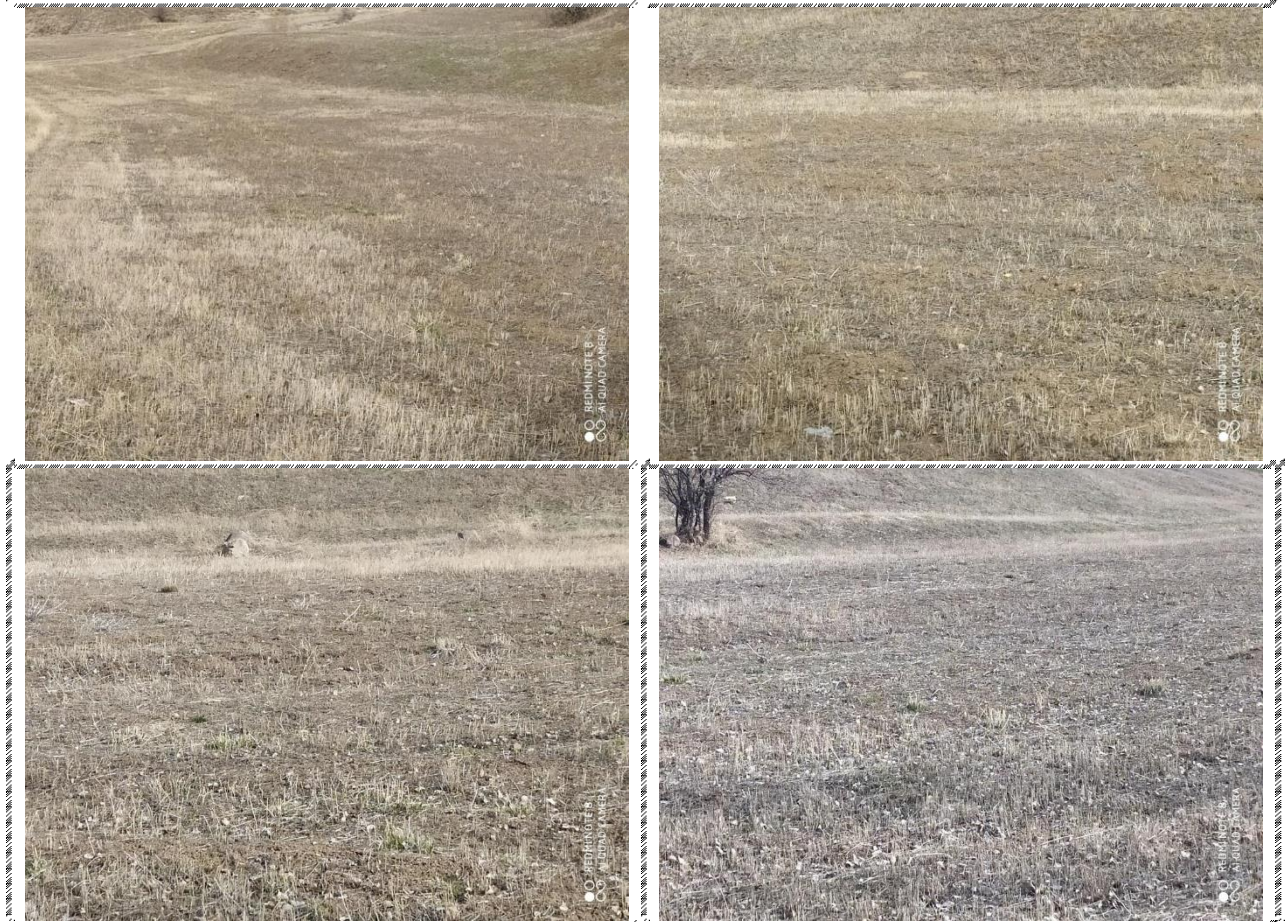
Անշարժ գույքի լուսանկարները