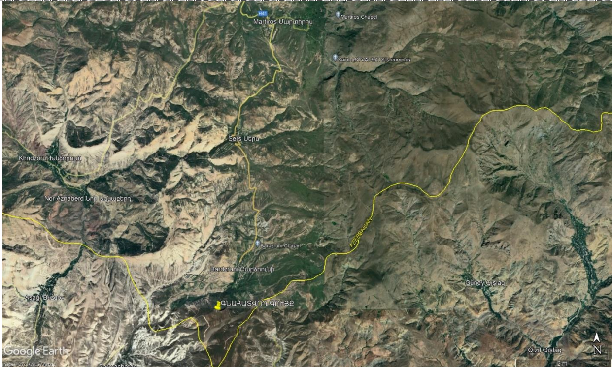
Գնահատվող գույքի գտվելու վայրը

https://www.google.com/maps/place/39%C2%B030'19.0%22N+45%C2%B028'23.2%22E/@39.5052831,45.4705231,17z/data=!3m1!4b1!4m4!3m3!8m2!3d39.505279!4d45.473098?hl=hy