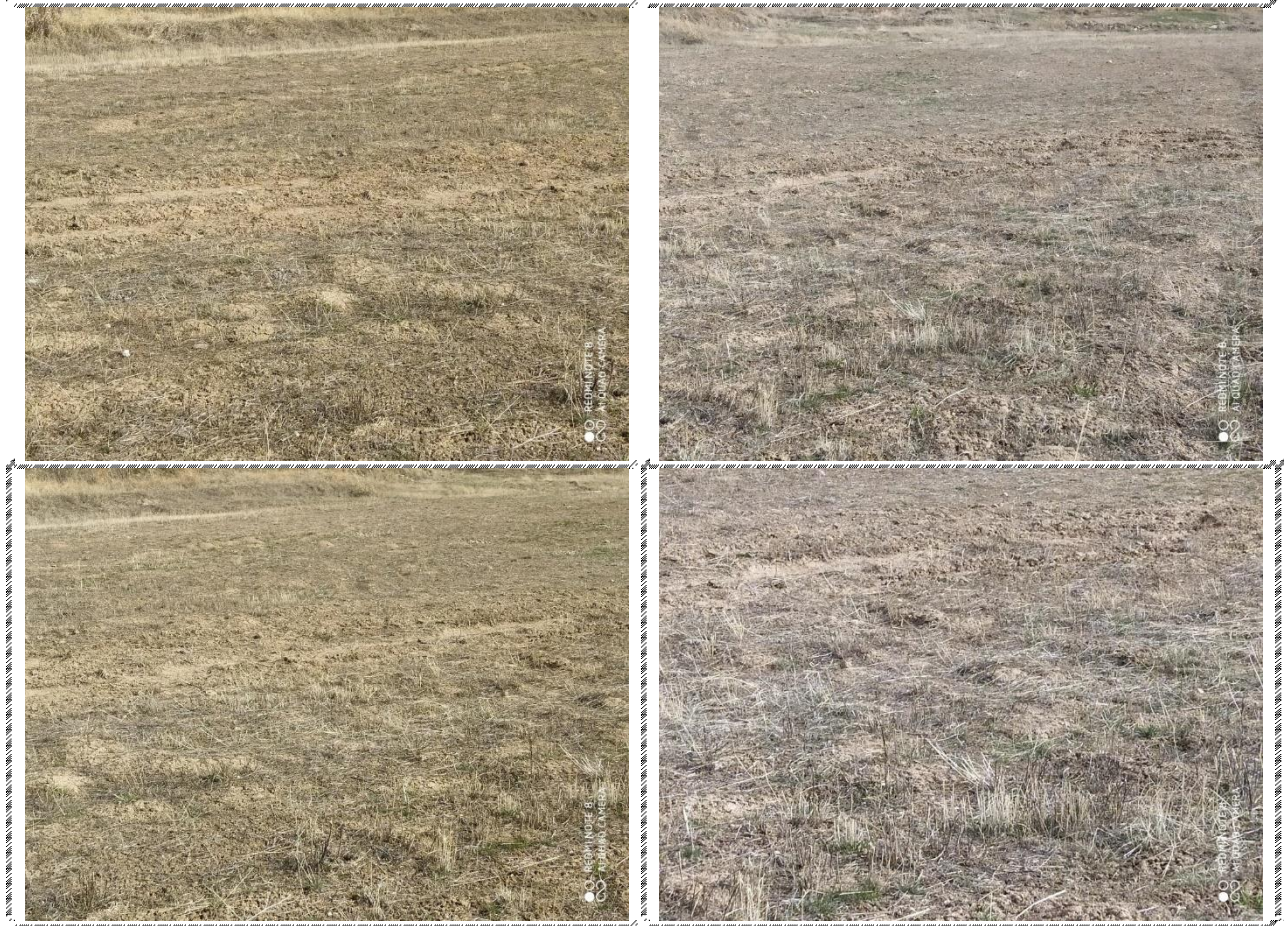
Անշարժ գույքի լուսանկարները