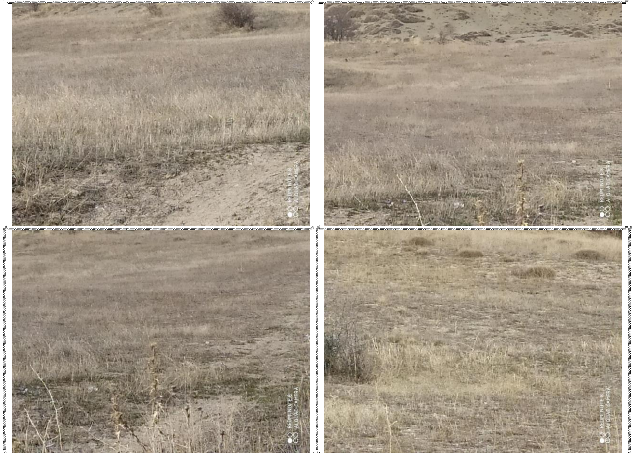
Անշարժ գույքի լուսանկարները