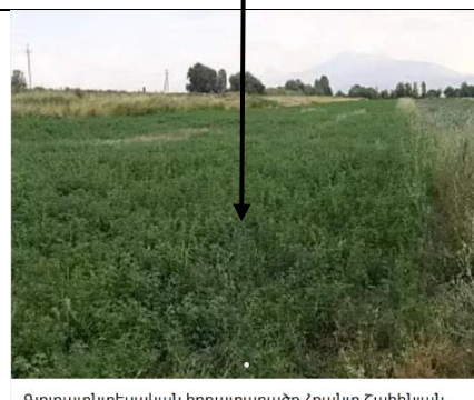
Գյուղատնտեսական հողատարածք Հրանտ Շահինյան փողոցում Մարալիկում, 6270 ք.մ. Գ Հրանտ Շահինյան փողոց, Մարալիկ $7,200 ~