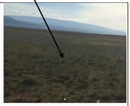
Գյուղատնտեսական հողատարածք, Սուլիա Շիրազ Մարալիկում, 7800 ք.մ. Գ Սուլիա Շիրազ 16, Մարալիկ $4,200 ~