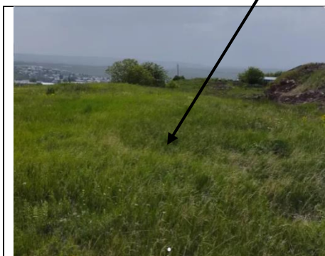
Գյուղատնտեսական հողատարածք Արթիկում, 1300 ք.մ. Գ Շիրակ - Արթիկ $1,500 ~