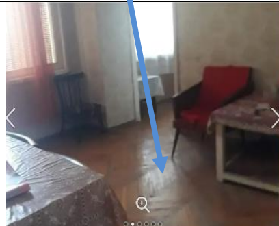
2 սենյականոց բնակարան Մեծամորում, 48 ք.մ., Նախալերջին հարկ, քարե շենք