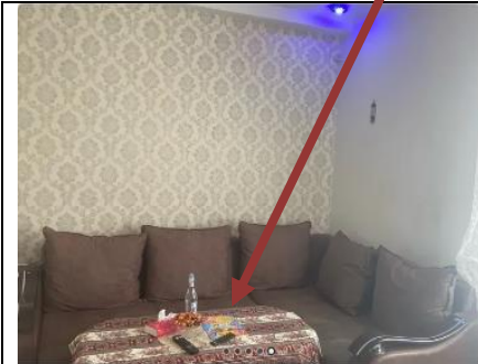
1 սենյականոց բնակարան Մեծամորում, 18 ք.մ., եվրոկերամիկոսով