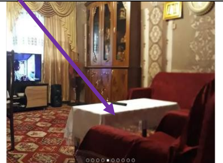
2 սենյականոց բնակարան Մեծամորում, 58 ք.մ., քարե շենք